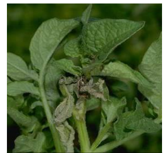
Figura No. 6

El rendimiento comercial del cultivo de papa se reduce con defoliaciones a partir del 33% a partir de la etapa de floración (sexta semana después de la emergencia del cultivo), esto permite sugerir no realizar aspersiones de insecticidas antes de la etapa fenológica de floración; favoreciendo de esta forma la acción de los enemigos naturales de la plaga (Figura No. 6).